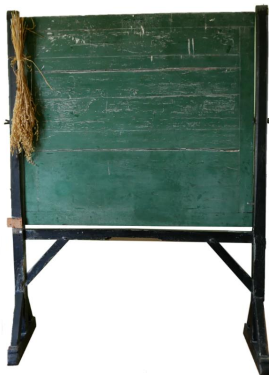
Le tableau noir original, qui se trouve toujours dans la mairie

Cinq kilomètres le séparaient de l'école, il partait donc à pied de Germont très tôt le matin, rejoignait ses copains de Bellegarde pour passer devant la Joubert par des chemins de terre qui, l'hiver et par temps de pluie, étaient très boueux. Ils s'enfonçaient et glissaient parfois dans cette terre argileuse qui collait à leurs sabots ou sous leurs chaussures montantes à semelle en bois (galoches). Les pieds restaient