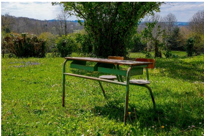
L'un des derniers pupitres d'école encore debout dans la Mairie