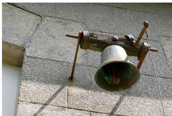
La cloche de l'école

La cloche est toujours là, derrière la mairie, fidèle au poste, prête à sonner la fin de la récréation, car bien que fermée, ce sera toujours NOTRE ECOLE.