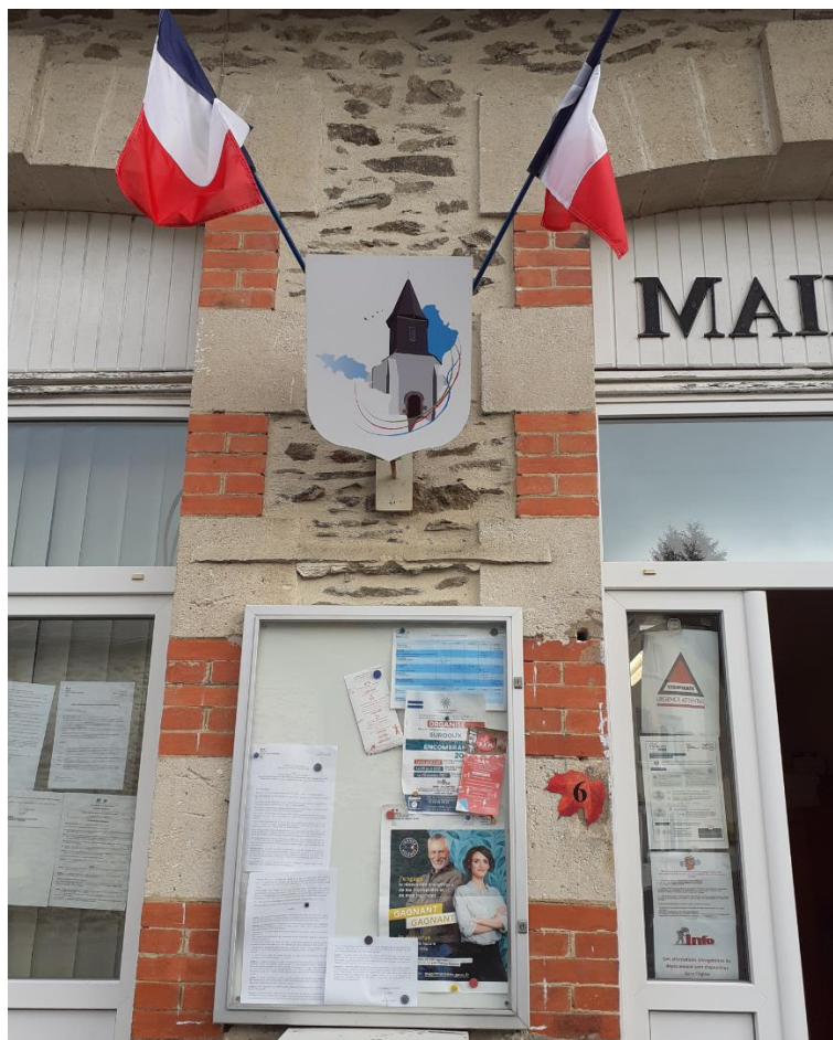
Le blason sur la façade de la Mairie

Enfin, terminons avec un détail. Il s'agit des oiseaux mais pas n'importe lesquels. Il s'agit d'hirondelles qui se plaisent à revenir chez nous chaque fin d'hiver mais qui depuis l'enterrement des lignes électriques ne savent d'ailleurs plus trop où se poser. On peut aussi associer à cette représentation une idée de liberté.